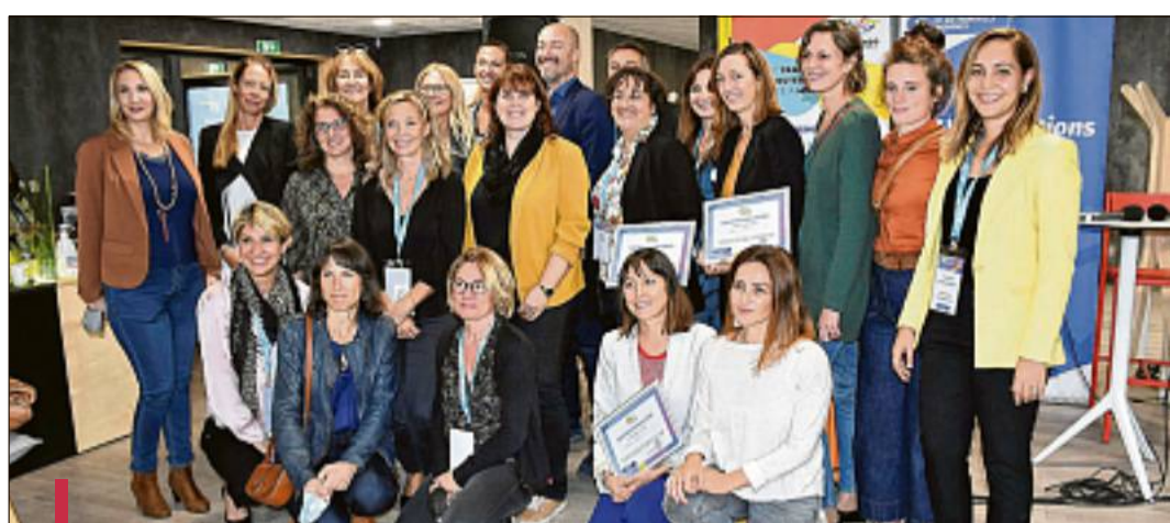
À la fin d'une journée intense avec tables rondes, conférences et ateliers, a été décernée la remise des prix du concours de pitchs.

À la fin d'une journée intense avec tables rondes, conférences et ateliers, a été décernée la remise des prix du concours de pitchs. Il permettait de mettre en avant son projet auprès de l'écosystème entrepreneurial, afin de gagner en visibilité et d'accélérer le développement du projet. Le pitch durait 3 minutes, suivi de ques-